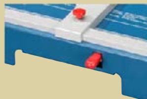
Nuevo tipo de prensado conectable y desconectable