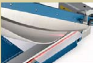
Indicación de corte por medio de rayo láser