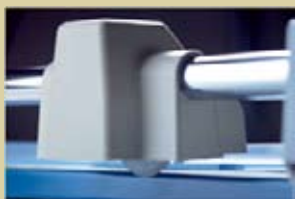
Cabezal de corte